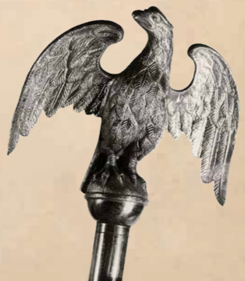
10. Głowice sztandarów polskich formacji wojskowych – I wojna światowa (pierwsza – III Brygady Legionów, druga – 4 pułku piechoty III Brygady Legionów, trzecia – oddziału piechoty Armii gen. Hallera, czwarta – 1 Pułku Strzelców V Dywizji Syberyjskiej).

Do trzeciej grupy należy głowica umieszczona na drzewcu noszonym przed oddziałami Armii Generała Hallera, tworzonymi na terenie Francji. (il. 11). Głowica ta swoją formą wyraźnie nawiązuje do orłów pułkowych z czasów Księstwa Warszawskiego. Pokażnych rozmiarów pełnoplastyczny orzeł z koroną na głowie i uniesionymi do góry skrzydłami (wys. 22 cm, szer. 19 cm) siedzi na tablicy (wys. 7,7 cm, szer. 17 cm) z napisem „WOJSKO POLSKIE” na stronie licowej i datą „MLCCCCXIX” na odwrocie.