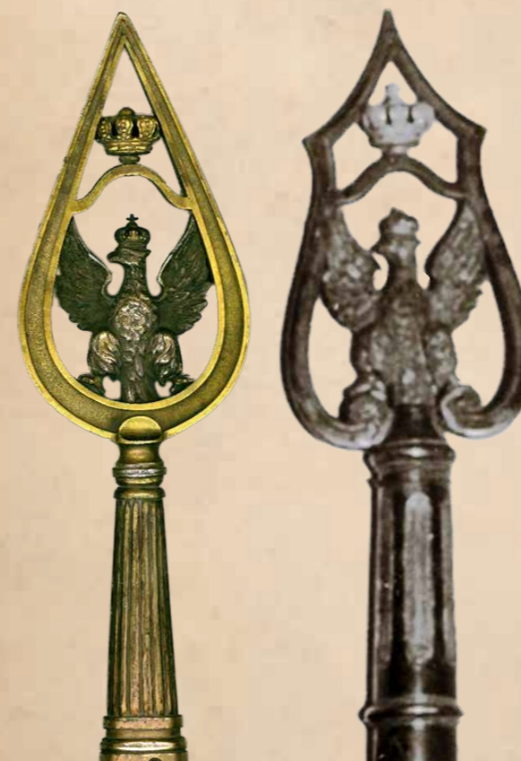
4. Głowice z czasów Królestwa Polskiego (1815-1830). Pierwsza z chorągwi pułków piechoty. Druga ze sztandarów kawalerii.

Upadek Napoleona a co za tym idzie Księstwa Warszawskiego i powstanie nowego tworu państwowego – Królestwa Polskiego, zależnego całkowicie od Rosji spowodowało konieczność wymiany chorągwi dla piechoty i sztandarów dla kawalerii na nowe wzory oparte na symbolice rosyjskiej. Głowice podobnie jak rosyjskich chorągwi dla piechoty miały kształt ażurowego, lancetowego grotu z tuleją kanelowaną (wys. z tuleją 29,5 cm, wys. grotu 16,5 cm, szerokość grotu 8,6 cm) i nieco bardziej fantazyjnego nieznacznie mniejszego dla kawalerii. W obu przypadkach wewnątrz umieszczony był ukoronowany orzeł polski o uniesionych do góry skrzydłach. Nad nim znajdowała się dodatkowo korona wkomponowana w szpic grotu oparta na łukowo wygiętej taśmie (il. 4). Grot i tuleja odlewane były z mosiądzu, orzeł i korona osobno wykonane, orzeł srebrzony.