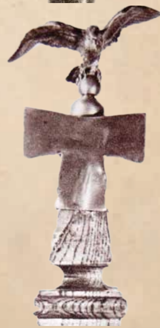
18. Różne typy głowic sztandarów z lat 1944-1945 (pierwsza – 5 Saskiej Dywizji Piechoty, druga – 10 Pułku Piechoty, trzecia – 14 Sudeckiej Brygady Artylerii Przeciwpancernej, czwarta – 7 Łużyckiej Dywizji Piechoty, piąta – I Warszawskiej Brygady Inżynierjno-Saperskiej).

Po zakończeniu działań wojennych starano się ujednolicić wygląd sztandarów wojskowych i głowic sztandarowych (il. 19) wprowadzając najpierw wzór oparty ściśle na przedwojennym, z nieco innym orłem na głowicy, potem wprowadzając sztandar wz. 1946 z niezwykle ciekawą głowicą w stylu późnego art. deco, gdzie mocno przestylizowane, uniesione wysoko do góry skrzydła orła kojarzyć się miały ze skrzydłami husarskim; wreszcie w 1955 r. pojawia się całkowicie nowy wzór sztandaru, który przetrwa aż do zmiany ustroju po 1989 r. W tym przypadku płaskiego orła identycznego jak w oficjalnym herbie osadzono na niewielkim cokoliku prostopadłościennym o wydatnych krawędziach górnych i dolnych.