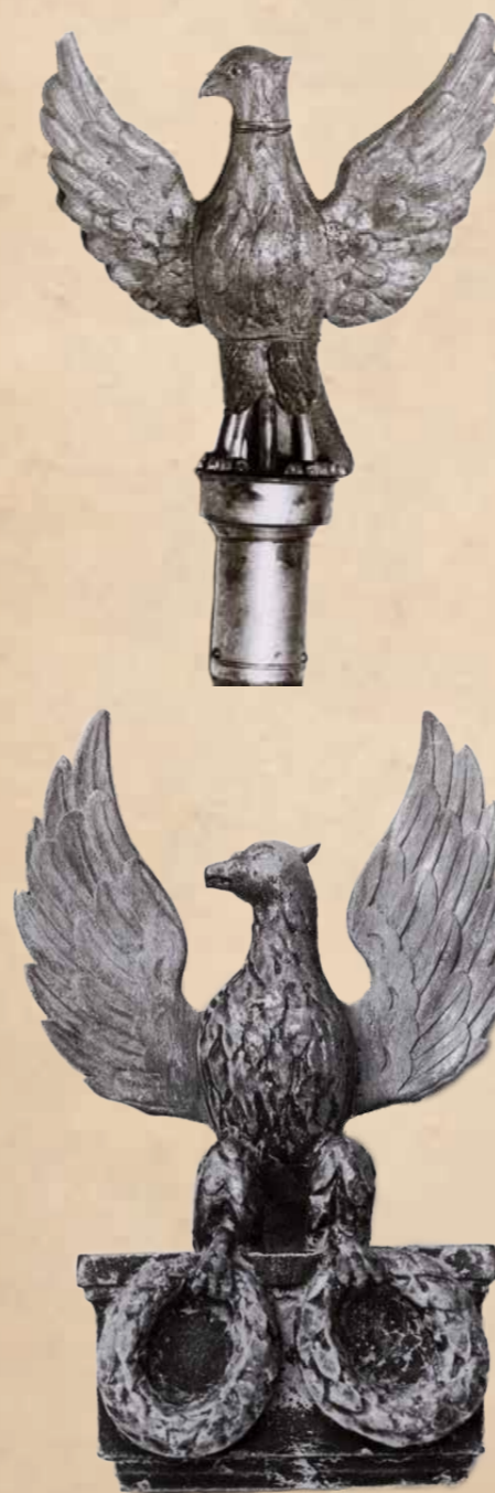
8. Głowice sztandarów z lat 1832-1848 (pierwsza – oddziału walczącego pod Miłosławiem w Poznańskim w czasie Wiosny Ludów, druga – Towarzystwa Demokratycznego w Paryżu z 1832 r.).

oddziału walczącego pod Miłosławiem to pełnoplastyczny, mosiężny orzeł bez korony, o uniesionych do góry skrzydłach siedzący na tulei z cylindryczną podstawą. (wys. całkowita 21 cm, szer. 20,5 cm). Głowica sztandaru Towarzystwa Demokratycznego w Paryżu, które powstało w środowisku emigrantów przybyłych do Francji po upadku powstania listopadowego, choć nie wojskowa, to stanowiła prawdopodobnie pierwowzór dla głowic sztandarów odrodzonego po I wojnie Wojska Polskiego. Pełnoplastyczny orzeł bez korony o uniesionych do góry skrzydłach (wys. 16,5 cm, szer. 16 cm) siedzi na podstawie – cokole prostopadłościennym (wys. 7 cm, grubość 5,4 cm, szer. 12 cm) o wydatnej górnej ścianie. Na ścianie licowej dwa wieńce laurowe trzymane w szponach orła. Całość rzeźbiona z drewna.