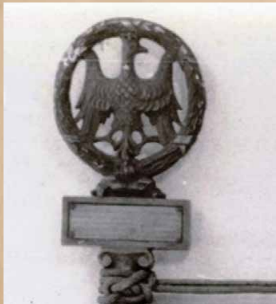
13. Głowica Związku Wojskowych Polaków w Dorpacie – pierwsza, 10 Pułku Strzelców Pieszych III Dywizji I Korpusu Polskiego – druga.

W odrodzonym po 1918 r. Wojsku Polskim ujednolicono wzory sztandarów przepisami z 1919 i 1927 r., przyjmując wzór głowicy przedstawiającej orła w koronie zamkniętej o uniesionych do góry skrzydłach, siedzącego na podstawie – prostopadłościennym cokole z numerem pułku na ścianie licowej (il. 14). Do połowy lat dwudziestych dominował typ głowicy z dużym dynamicznym orłem (wys. 24 cm, szer. 20 cm) i stosunkowo niskim cokolem o bardzo wydatnej ścianie górnej (dł. 10 cm, szer. 5 cm, wys. 5 cm). W latach późniejszych zmieniono proporcje elementów głowicy. Orzeł jest już mniejszy, bardziej statyczny (wys. 18 cm, szer. 16 cm.) a podstawa proporcjonalnie wyższa o mniej wydatnej ścianie górnej (wys. 5 cm, szer. 4,8 cm, dł. 8,8 cm).