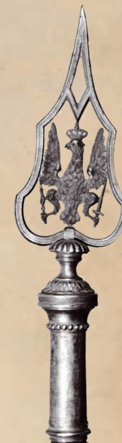
2. Głowica chorągwi gwardii pieszej koronnej i chorągwi regimentowych piechoty, lata osiemdziesiąte XVIII w.

Przez niemal cały XVIII w. orzeł na głowicach chorągwi nie pojawia się, ustępując miejsca rozbudowanym monogramom królewskim wpisanym wewnątrz grotów. Dopiero w latach osiemdziesiątych XVIII w. pojawia się na głowicach chorągwi gwardii pieszej koronnej i chorągwi regimentowych piechoty (il. 2). Ukoronowany orzeł o uniesionych do góry skrzydłach trzymający w łapach berło i miecz umieszczony został wewnątrz ażurowego grotu o płynnych, późno rokokowych kształtach osadzonego na ozdobnym guzie z przewężeniem przechodzącym dołem w tuleję (dł. z tuleją 35 cm).