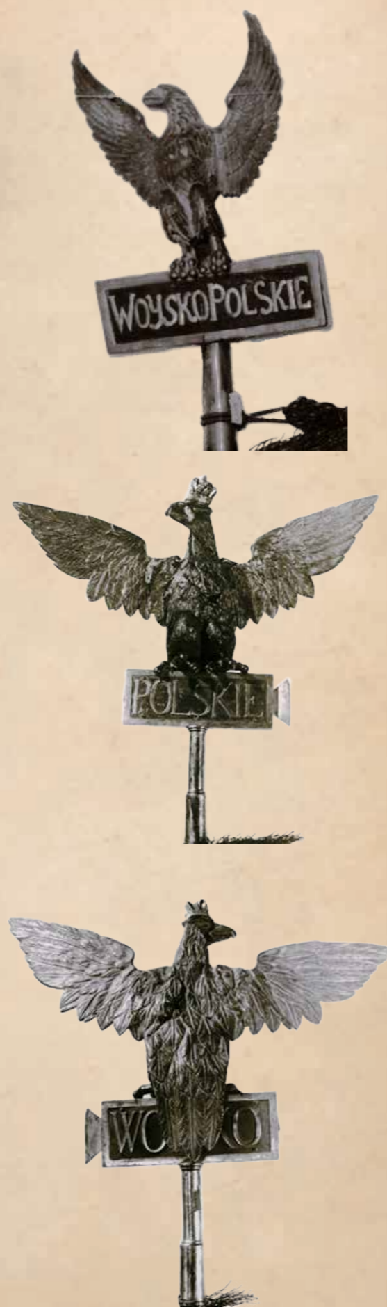
3. Głowice sztandarów Wojsk Księstwa Warszawskiego (pierwsza – głowica typowa, druga – 3 pułku piechoty, trzecia – 1 pułku piechoty).

Przy niewielkich rozmiarach płatów sztandarów, lub zastąpieniu ich tylko wstęgą zawiązaną w kokardę taka głowica stała się elementem dominującym i w związku z tym cały sztandar zaczęto wówczas określać mianem orła pułkowego. Dla podkreślenia tradycji Wojska Polskiego nazwa ta ciągle używana jest w pozaregulaminowej terminologii.