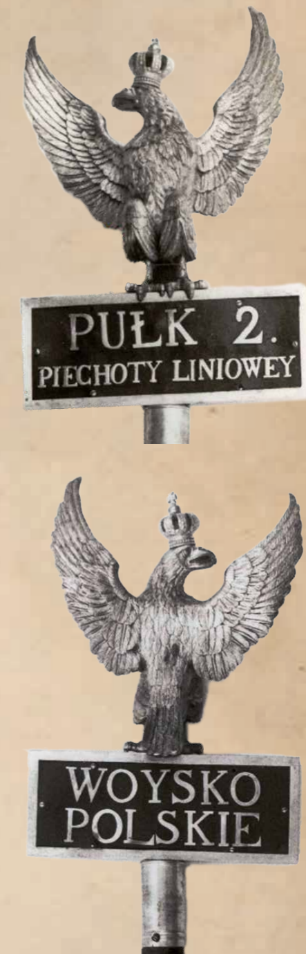
5. Głowice sztandarów tzw. starych formacji z Powstania Listopadowego (1830-1831).

Warszawskiego. Wyciągnięto po prostu jeden z orłów przechowywanych w Arsenale Warszawskim i skopiowano go. (il. 5). Sztandary te nigdy nie zostały wręczone wojsku, gdyż obawiano się, że w starciach z armią rosyjską żołnierz polski nie dotrzyma pola i utraci swoje sztandary.