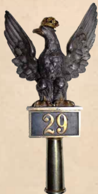
14. Głowice sztandarów z lat 1919-1939 (pierwsza – wersja wczesna, druga – wersja typowa wg wzoru 1927).

Oprócz tych dwóch podstawowych odmian pojawia się też kilka innych różniących się kształtem orła, prostopadłościenną podstawą, wymiarami i proporcjami (il. 15).