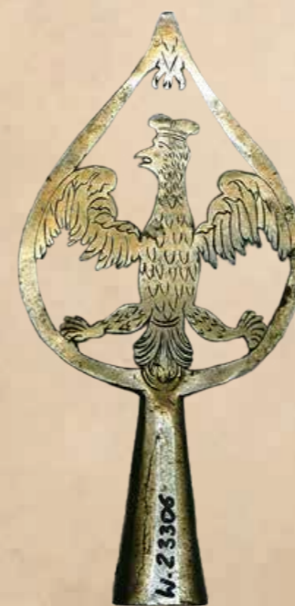
1. Głowica z wyobrażeniem orła, poł. XVII w.

Najstarsza znana głowica z wyobrażeniem orła pochodzi prawdopodobnie z poł. XVII w. (il. 1), ma kształt ażurowego, liściastego grotu z tuleją wielościanową (wys. 20 cm, szer. 10 cm). Orzeł umieszczony wewnątrz grotu ma rozpostarte na boki skrzydła, koronę na głowie, łapami i ogonem wspiera się na dolnej części obramienia grotu. Sam orzeł jak i grot z tuleją są nieco prymitywne w wykonaniu. W całości zrobione ze stali.