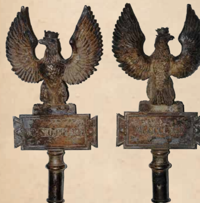
11. Głowica noszona na drzewcu przez oddziałami Armii gen. Hallera.

Do trzeciej grupy należy głowica umieszczona na drzewcu noszonym przed oddziałami Armii Generała Hallera, tworzonymi na terenie Francji. (il. 11). Głowica ta swoją formą wyraźnie nawiązuje do orłów pułkowych z czasów Księstwa Warszawskiego. Pokażnych rozmiarów pełnoplastyczny orzeł z koroną na głowie i uniesionymi do góry skrzydłami (wys. 22 cm, szer. 19 cm) siedzi na tablicy (wys. 7,7 cm, szer. 17 cm) z napisem „WOJSKO POLSKIE” na stronie licowej i datą „MLCCCCXIX” na odwrocie.