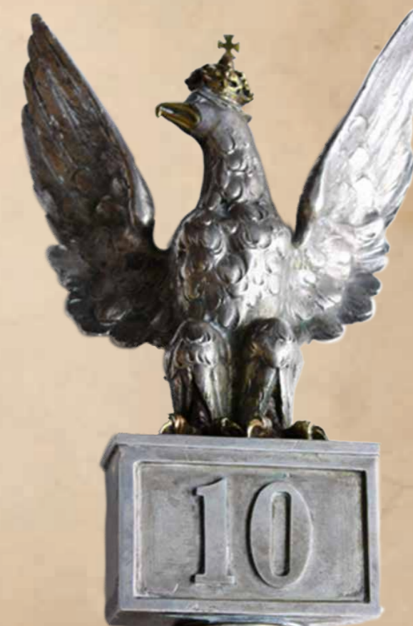
20. Głowica sztandaru wz. 1993.