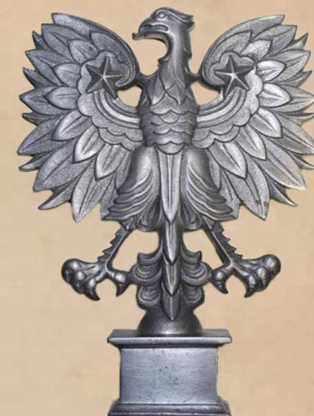
19. Głowice sztandarów z lat 1945-1990 (pierwsza – głowica sztandaru wz. 1945, druga - głowica sztandaru wz. 1946, trzecia – głowica sztandaru wz. 1955).

Obecnie Wojsko Polskie powróciło do przedwojennego wzoru sztandaru i tradycyjnej głowicy w postaci orła z koroną na głowie i uniesionymi do góry skrzydłami siedzącego na prostopadłościennym cokole z numerem pułku na przedniej ścianie (il. 20). Zgodnie z obowiązującym ceremoniałem wojskowym wewnątrz cokołu umieszcza się zminiaturyzowane kopie aktu nadania i aktu wręczenia sztandaru.