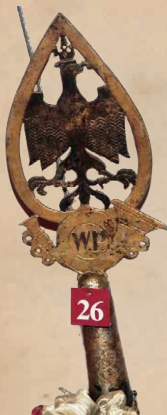
9. Głowice sztandarów polskich formacji wojskowych – I wojna światowa, Armia Ben. Hallera, Francja (pierwsza – Pułk Szkolny Strzelców Pieszych, druga – 5 Pułk Strzelców Pieszych (rysunek dokumentacyjny i fotografia).

Do drugiej grupy należy kilka głowic różniących się kształtem orła umieszczonego na kuli (il. 10). Głowica III Brygady Legionów ma kształt dynamicznego orła zrywającego się do lotu, o rozpostartych w bok, lekko opuszczonych do dołu skrzydłach, a głowica sztandaru 4 Pułku Piechoty tejże Brygady to mosiężny, srebrzony orzeł bez korony, o szeroko rozpostartych na boki skrzydłach. Dość charakterystyczne w tej grupie są dwie głowice sztandarów fundowanych przez organizacje polskie działające w USA dla oddziału piechoty Armii gen. Hallera i dla 1 Pułku Strzelców im. Tadeusza Kościuszki V Dywizji Syberyjskiej. Wykorzystano tu po prostu typowe głowice sztandarów i flag amerykańskich - orzeł bez korony o rozpostartych na boki, opuszczonych w dół skrzydłach siedzący na niewielkiej kuli.