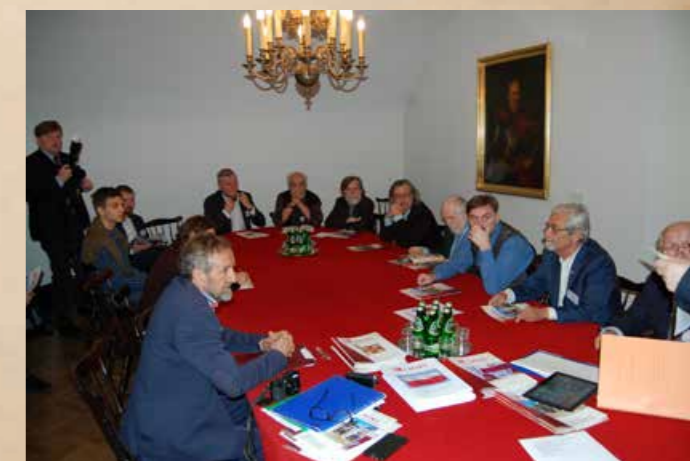
Obrady Polskiego Towarzystwa Weksylogicznego.