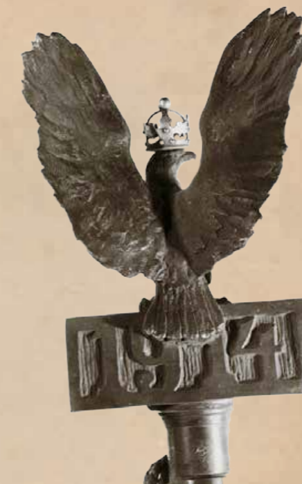
12. Głowica sztandaru 3 Pułku Piechoty II Brygady Legionów.

Ostatnią grupę stanowią dwie nietypowe głowice wykorzystujące oprócz orła motyw wieńca laurowego (il. 13). Drewniana głowica (wys. 29 cm) sztandaru Związku Polaków w Dorpacie to płaski orzeł z koroną na głowie, o uniesionych do góry skrzydłach siedzący na wieńcu laurowym przewiązanym u dołu wstęgą, a głowica sztandaru 10 Pułku Strzelców Pieszych III Dywizji I Korpusu Polskiego wykonana z metalu to płaski orzeł o opuszczonych w dół skrzydłach umieszczony wewnątrz wieńca laurowego zamocowanego na tabliczce – cokole z napisami fundacyjnymi.