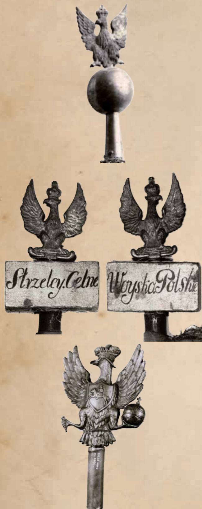
6. Głowice sztandarów nowych formacji z czasów Powstania Listopadowego (pierwsza – 19 pułku piechoty, druga – Strzelców Celnych województw krakowskiego i sandomierskiego, trzecia – oddziału powstańczego z terenu Litwy).

bości 3 cm) z napisem czarnym olejno na jednej stronie „Strzelcy Celne”, na drugiej „Wojsko Polskie”. Do oddziału powstańczego z terenów Litwy należała prawdopodobnie uszkodzona głowica z tuleją przedstawiająca tłoczonego z blachy orła ukoronowanego, z regalami w łapach i herbem Pogoń na piersi na obu stronach (wys. orła 28,5 cm, szer. 22,5 cm).