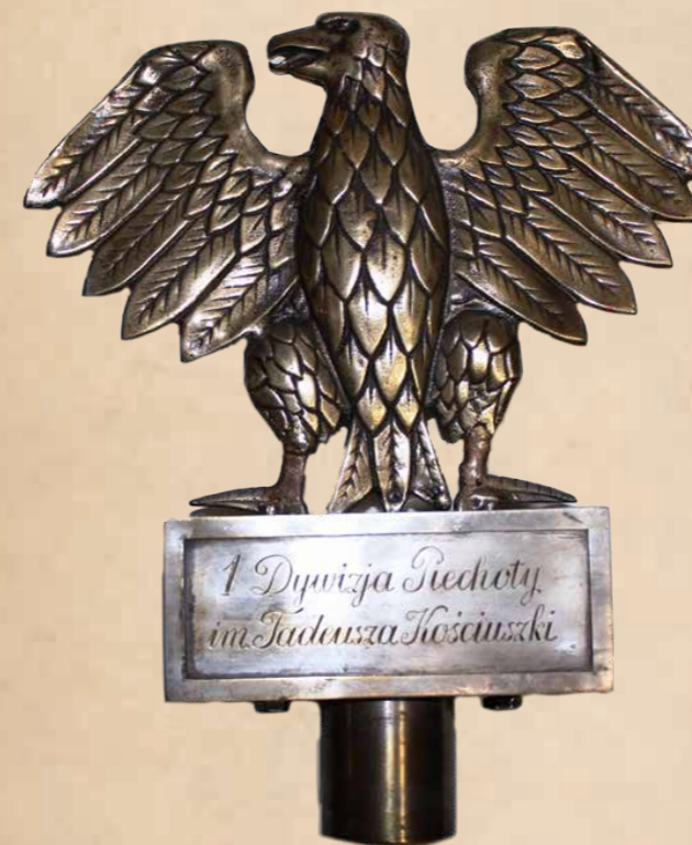
16. Głowica sztandaru 1 Dywizji Piechoty, z orłem tzw. „kuricą” wykonana w ZSRR w 1943 r.

W czasie II wojny światowej sztandary Polskich Sił Zbrojnych na Zachodzie nawiązywały wyglądem i symboliką do sztandarów przedwojennych. Inaczej było w przypadku oddziałów powstających od 1943 r. na terenie Związku Radzieckiego i na ziemiach polskich. Dla kilku dywizji formowanych w ZSRR opracowano nowy wzór orła wojskowego bez korony, znacznie odbiegający od dotychczasowej tradycji. Orzeł ten nazywany pogardliwie przez żołnierzy „kuricą” (czyli kurą) znalazł się nie tylko na czapkach żołnierskich ale także na płatach i głowicach sztandarów (il. 16), gdzie osadzony został na prostopadłościenną podstawę z wygrawerowaną nazwą dywizji na ścianie licowej. Orzeł był płaski tłoczony z blachy (wys. 15 cm, szer. 20 cm) a podstawa dość niska i mocno wydłużona (wys. 5 cm, dł. 17,4 cm, szer. 5 cm).