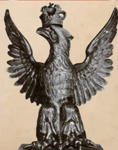
15. Głowice sztandarów z lat 1919-1939 – różne wersje orła na cokole skrzynkowym.

W czasie II wojny światowej sztandary Polskich Sił Zbrojnych na Zachodzie nawiązywały wyglądem i symboliką do sztandarów przedwojennych. Inaczej było w przypadku oddziałów powstających od 1943 r. na terenie Związku Radzieckiego i na ziemiach polskich. Dla kilku dywizji formowanych w ZSRR opracowano nowy wzór orła wojskowego bez korony, znacznie odbiegający od dotychczasowej tradycji. Orzeł ten nazywany pogardliwie przez żołnierzy „kuricą” (czyli kurą) znalazł się nie tylko na czapkach żołnierskich ale także na płatach i głowicach sztandarów (il. 16), gdzie osadzony został na prostopadłościenną podstawę z wygrawerowaną nazwą dywizji na ścianie licowej. Orzeł był płaski tłoczony z blachy (wys. 15 cm, szer. 20 cm) a podstawa dość niska i mocno wydłużona (wys. 5 cm, dł. 17,4 cm, szer. 5 cm).