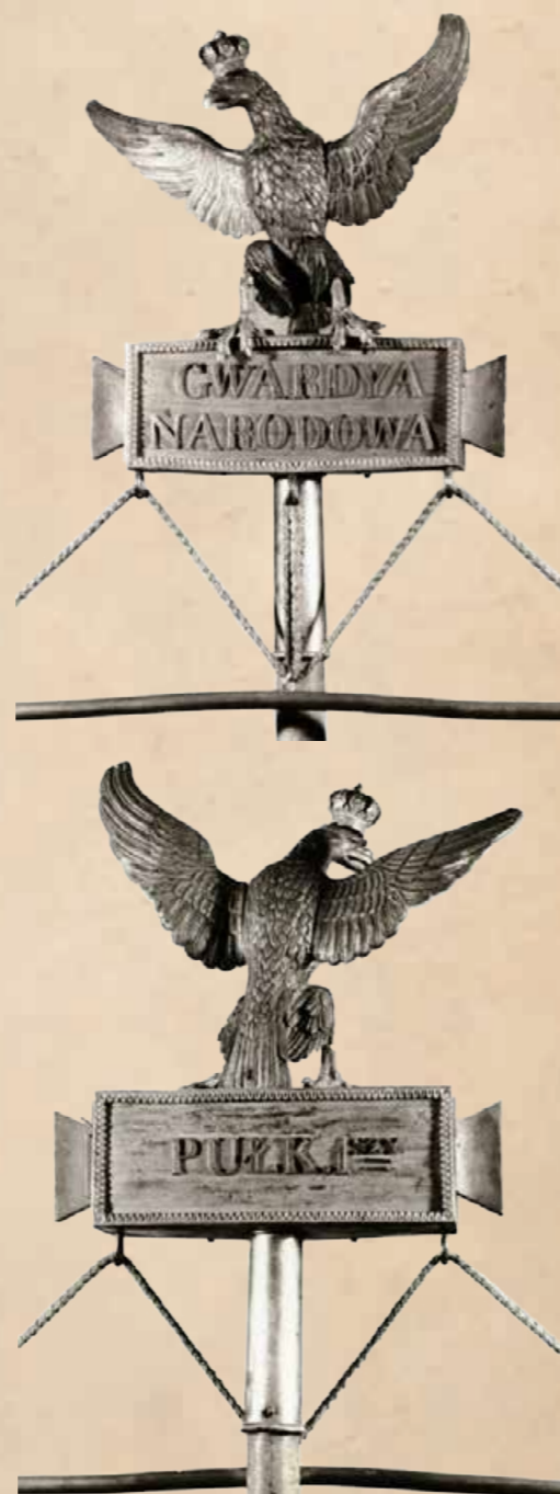
7. Głowica proporca 1 pułku gwardii narodowej warszawskiej.

Bardzo ciekawa jest głowica do proporca w typie labarum 1 pułku gwardii narodowej warszawskiej (il. 7). Pokażnych rozmiarów orzeł pełnoplastyczny (wys. 22,5 cm, szer. 27 cm), ukoronowany o uniesionych do góry skrzydłach lekko rozchylonych na boki siedzi na podstawie prostopadłościennnej (wys. 8,5 cm, szer. 22,2 cm, grubość 7 cm) z tuleją. Na ścianie licowej podstawy napis „GWARDYA/NARODOWA”, na ścianie tylnej „PUŁK 1szy” Orzeł lany z brązu, srebrzony. Podstawa z brązu srebrzonego i złotanego.