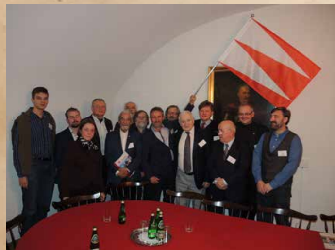
Pamiątkowa fotografia na zakończenie obrad.

W trakcie dyskusji poruszono wiele ciekawych tematów dotyczących weksylo-logii oraz wyrażono konieczność szerszego rozpropagowania wśród społeczeństwa tej dziedziny nauki.