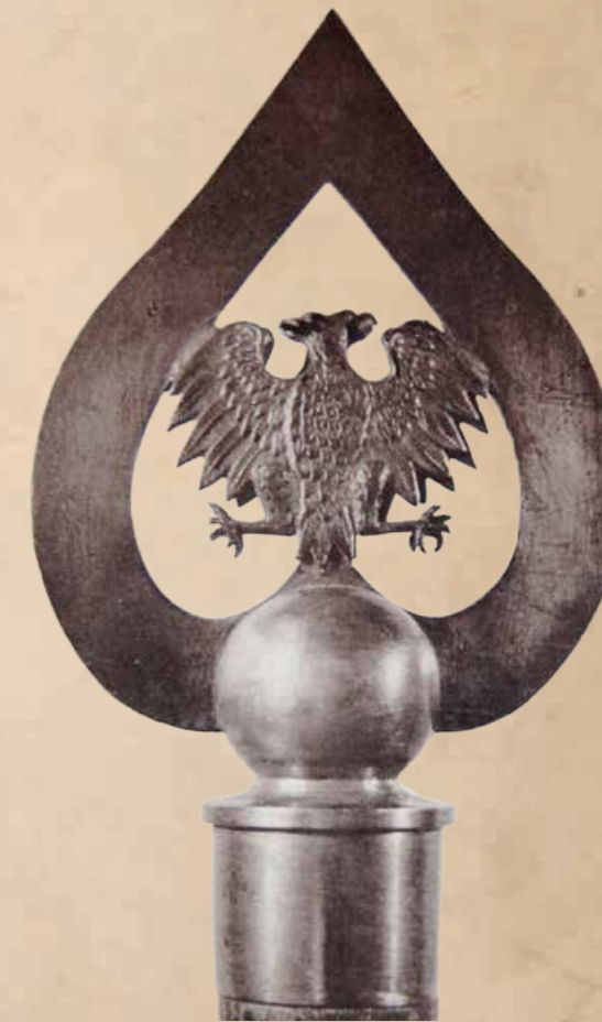
17. Głowice sztandarów z lat 1944-1945 z wkomponowanym orłem z czapek żołnierskich (pierwszy – 36 Łużyckiego Pułku Piechoty, drugi – 5 Pomorskiej Brygady Artylerii).

Wśród sztandarów fundowanych już na terenach polskich starano się nie eksponować nielu-