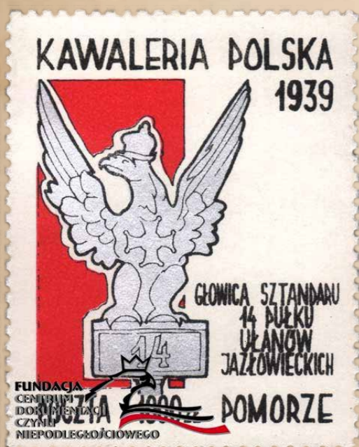
Głowica sztandarowa 14 Pułku Ułanów Jazłowieckich na znaczku wydanym przez niezależną Pocztę Pomorze w 1990 r.

Since the beginning of the Polish statehood, eagles would appear on military regiments. Over the next few centuries, their poles were embellished only with spearheads resembling spears, which often played a role of the said regiment pole. In XVI those simple, deprived of any kind of symbolism spearheads started gaining more ornaments. Complex, flat, leafy copestones appeared, on which it was possible to place monograms or heraldic figures. With time, next to those flat but full spearheads appeared open-work, delicate, even more embellished ones, allowing to express said symbolism within the framing. That is exactly where the first eagle appeared as a part of the Polish military regiment's head, around XVII century. Solid, three-dimensional eagles crowning the banners' heads appeared in the Polish military following the French during the beginning of the Napoleonic era. This form of the head, with an eagle sitting on a flat plate, a rectangular pedestal or a sphere dominates in the Polish military symbolism at least since the beginning of XX.